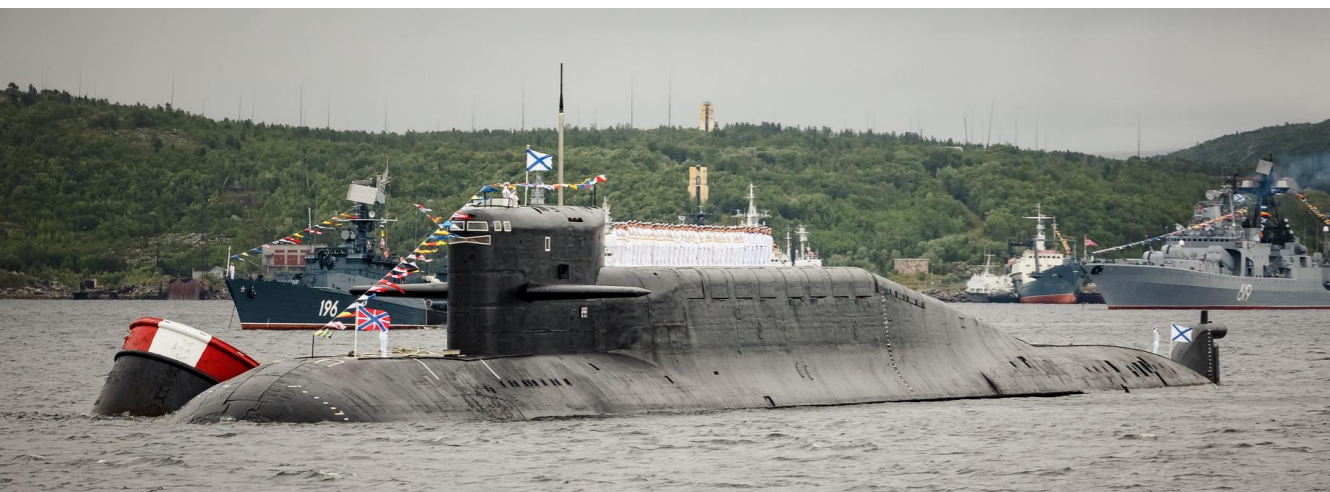
ЗАТО Североморск - главная административная база Северного флота России